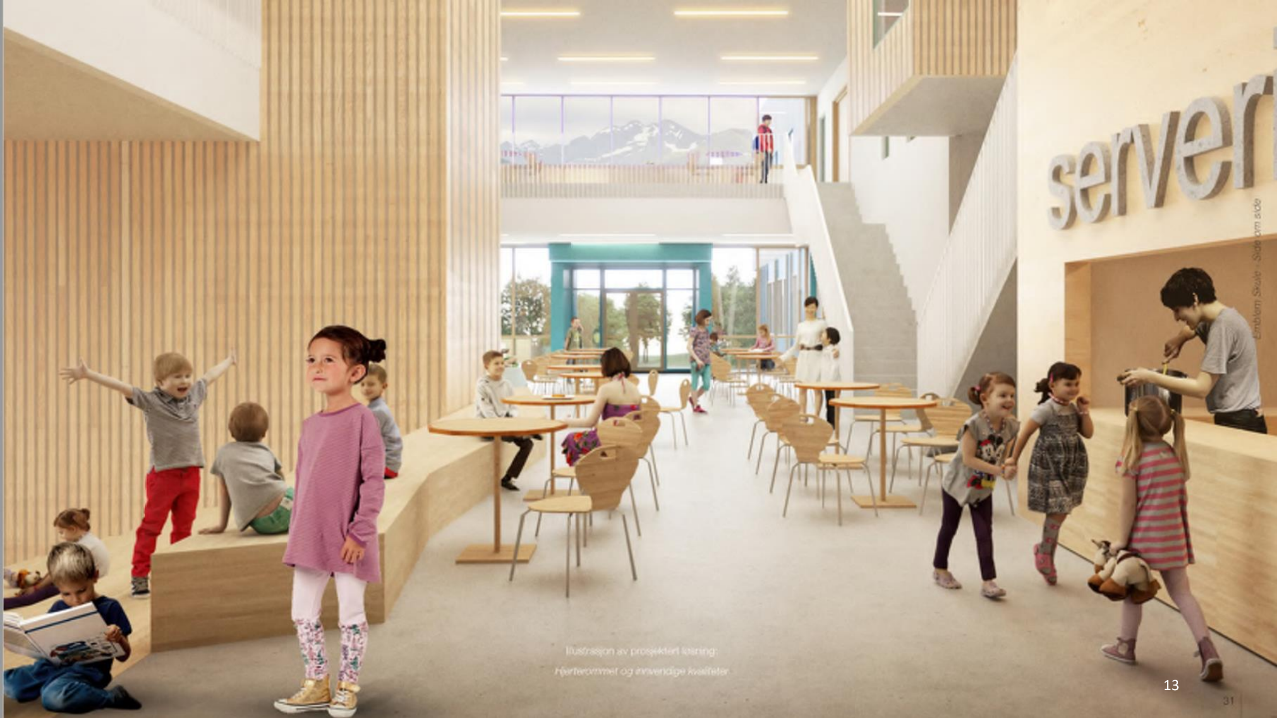
Illustrasjon av projekteret løsning: Hørtterommet og anvendige kvaliteter.