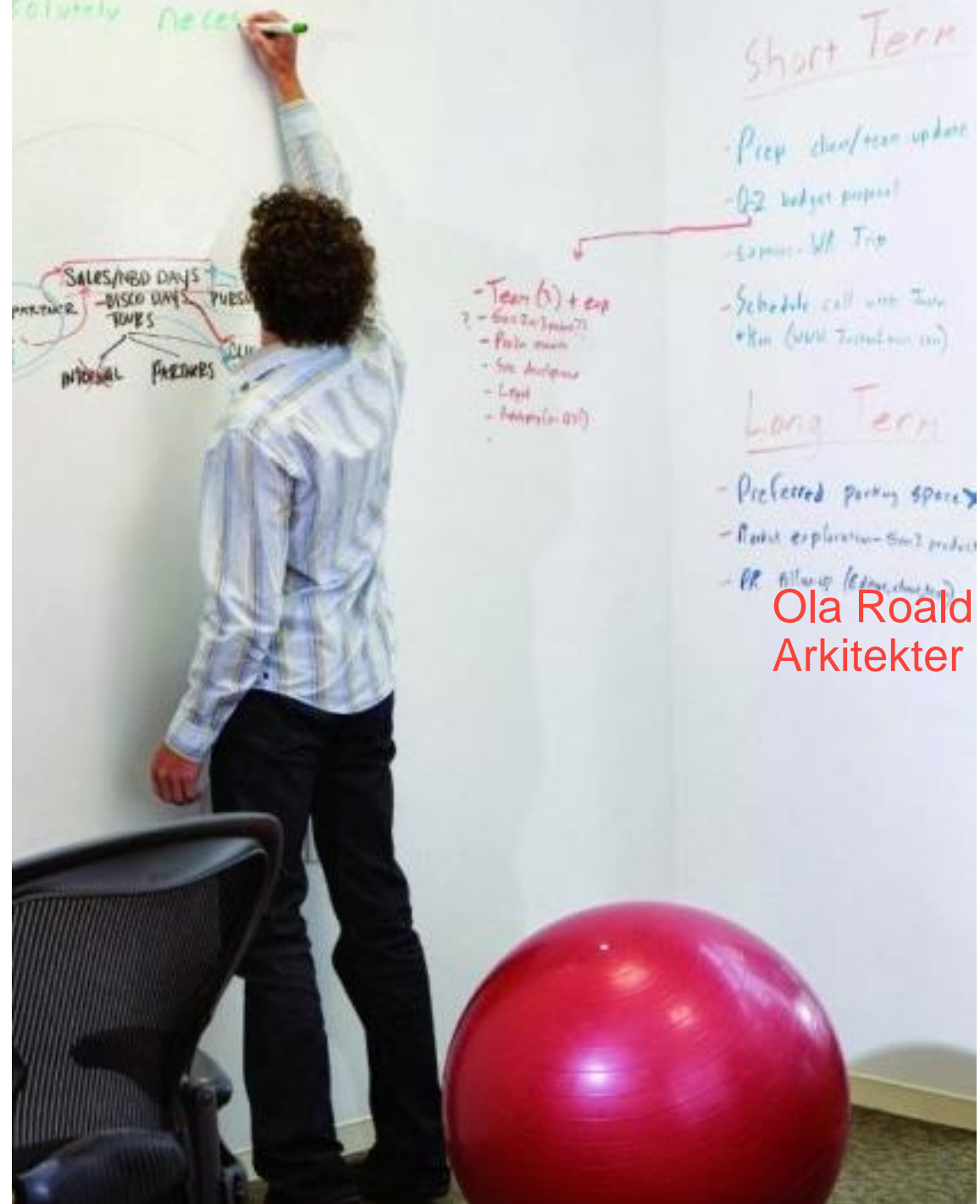
Ola Roald Arkitekter