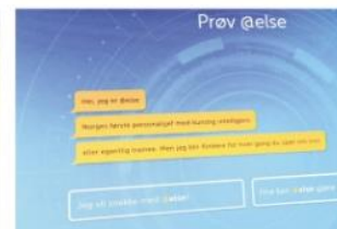
@elses ansikt: Slik ser velkomstmeldingen ut for dem som har noe de vil ta opp med personalroboten.