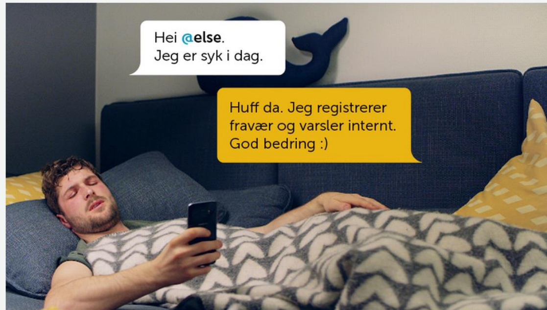
Slik kan det se ut når en medarbeider kontakter sin digitale personalsjef for å melde sykefravær.