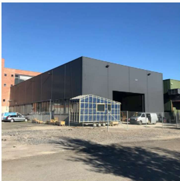
Fabrikkhall 0,00 kr

ALL BYGGEVARER DØRER KOMPLETT BYGG TRELAST VINDUER