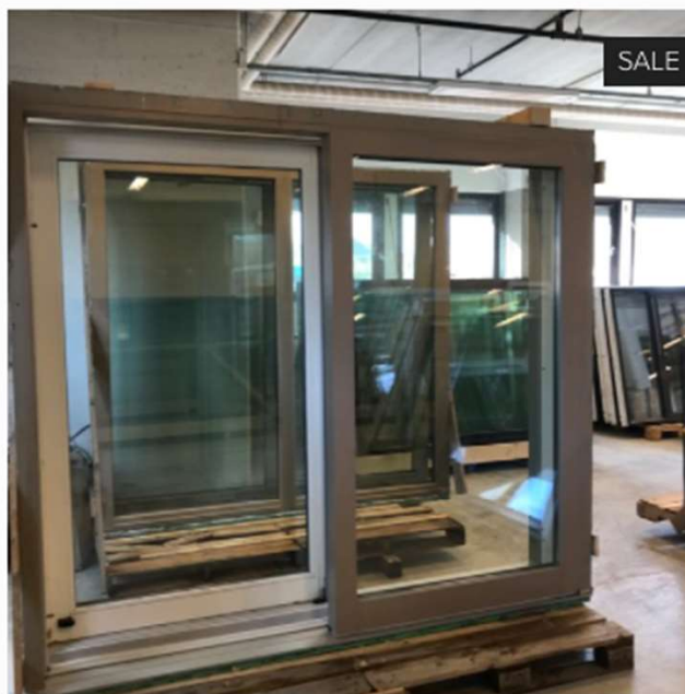
Heve skyvedører, ombruk. 10,000.00 kr 22,000.00 kr