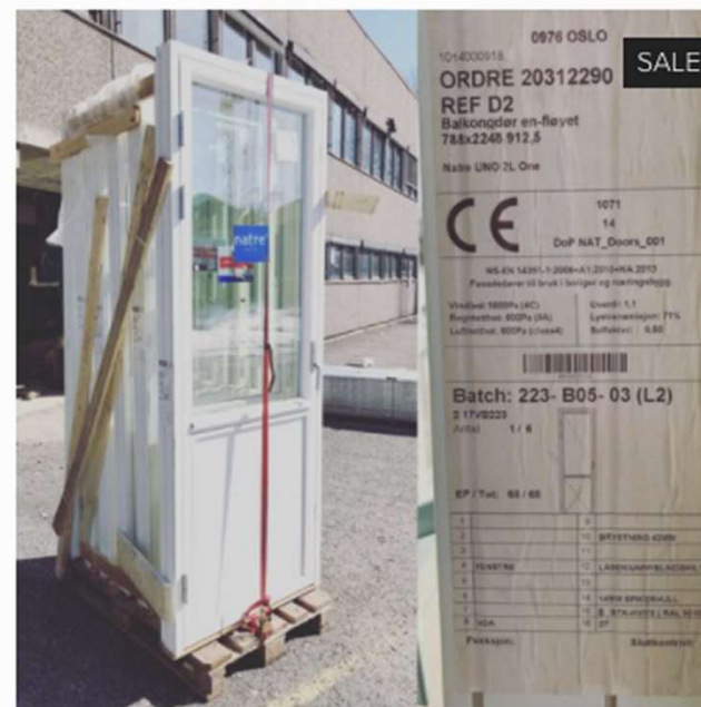
Natre terrassedører, ombruk 3,500.00 kr 10,500.00 kr

101400018 0976 OSLO ORDRE 20312290 SALE REF D2 Balkondør en-fløyet 788x2248 912.5 Natre UNO 2L One CE 1071 14 DoP NAT_Doors_001 NS-EN 14351-1:2008+A1:2013/EN 12127 Fasadedør til bruk i bolig og næringsbygg Vindtet 1800Pa (C2) Løst: 1.1 Regnetet 800Pa (A2) Løst: 1.1 Løst: 800Pa (A2) Løst: 1.1 Batch: 223- B05- 03 (L2) 2 1705223 Antal 1 / 6 1 1 1 2 10 BRVETANG 4200 3 11 4 12 LARVINGSMØRTEL 5 13 6 14 LARVINGSMØRTEL 7 15 STIKKUTTE (SAL 9125) 8 16 Pakkedel: Skullestikk