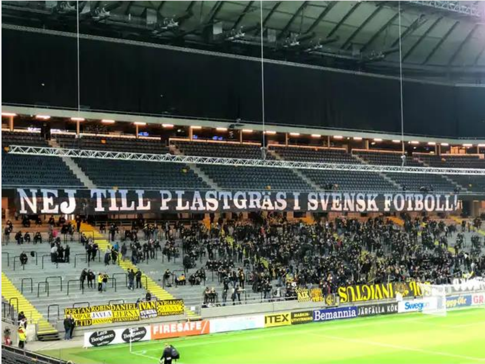
Norra Stå:s banderoll inför matchen mot J-Södra: "Nej till plastgräs i svensk fotboll"!